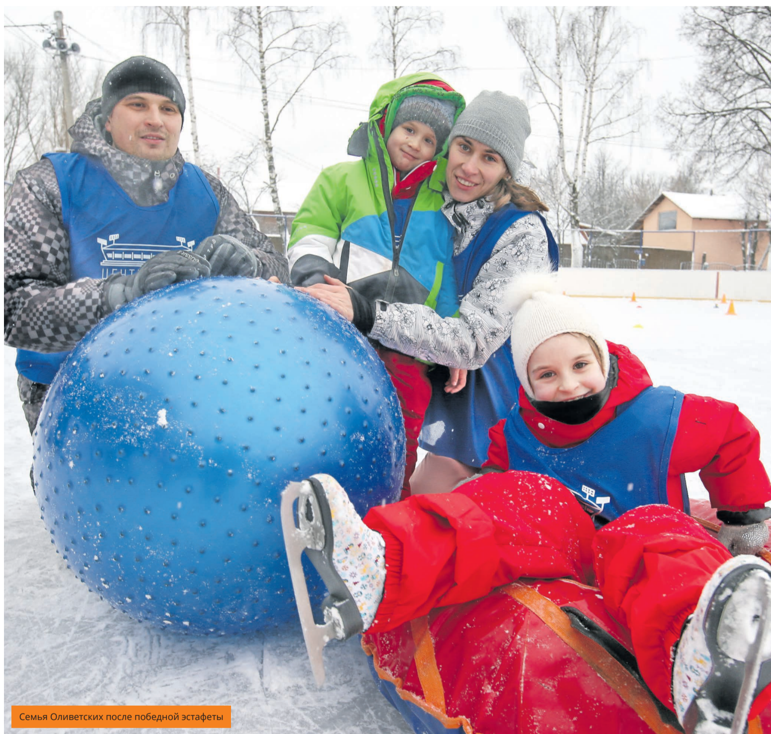
Семья Оливетских после победной эстафеты

В ФИНАЛ ГОРОДСКОЙ СПАРТАКИАДЫ ВЫШЛА СЕМЬЯ ИЗ МОСКОВСКОГО