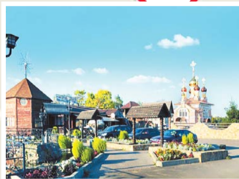
п. Ульяновского лесопарка