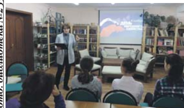
№ 259

Этот день посвящен событиям 1612 года, когда народное ополчение под предводительством Козьмы Минина и князя Дмитрия Пожарского освободило русскую землю от польских интервентов. Их патриотический подвиг не позволил распасться России, помог состояться нашему государству. Ребята с интересом слушали подготовленный сотрудниками рассказ, участвовали в обсуждении, посмотрели фрагменты из фильма «Минин и Пожарский».