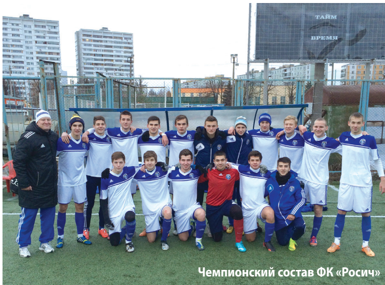
Чемпионский состав ФК «Росич»