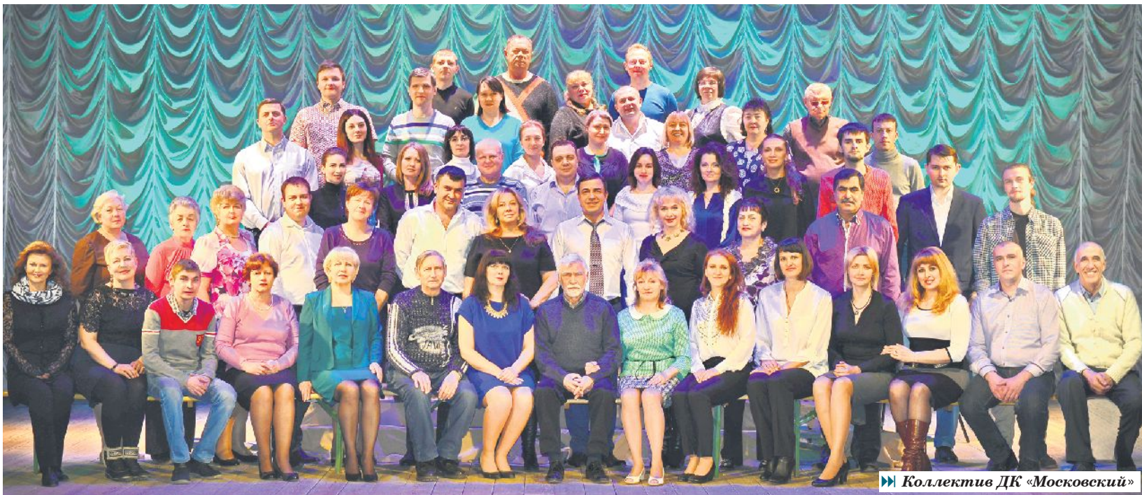
► Коллектив ДК «Московский»