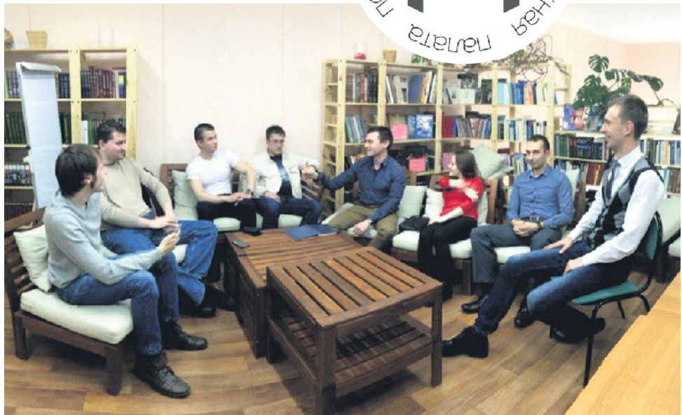
» Дискуссионный клуб 12 марта