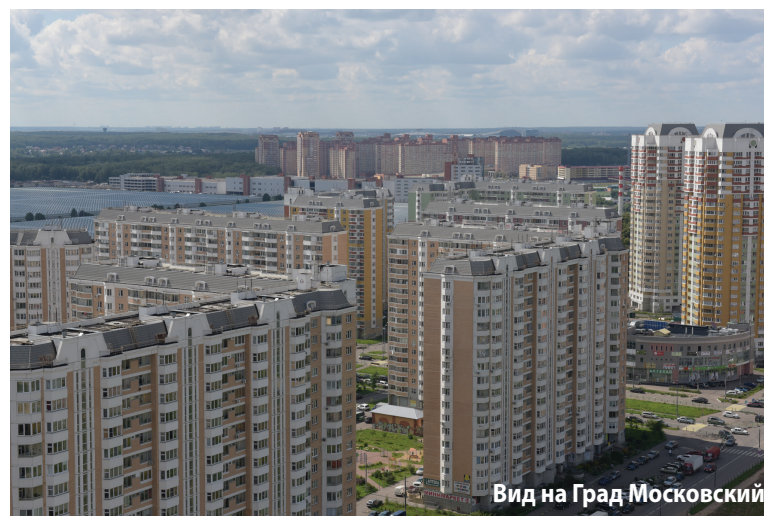
Вид на Град Московский

В план озеленения добавлена высадка более 200 деревьев в раз-