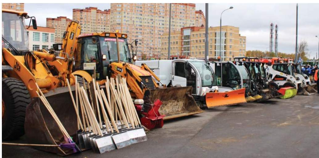
16 октября 2017 года. Снегоуборочная техника готова сразиться со снегом.

По просьбе жителей микрорайона Первый Московский город-парк коммунальные службы провели опилку сухостойных деревьев на березовой аллее. Все заявки горожан по поводу сухостоя и аварийных деревьев, поступающие в администрацию поселения, оперативно обрабатываются. Опилка деревьев производится только после получения разрешения от Департамента природопользования и охраны окружающей среды Москвы.