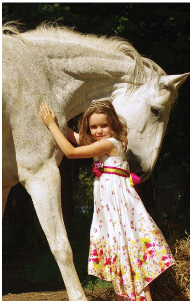
Фотография сделана участницей фотокружка «Перспектива» Дворца культуры «Московский» Викторией Лукьяновой для фотовыставки «Природа в объективе».