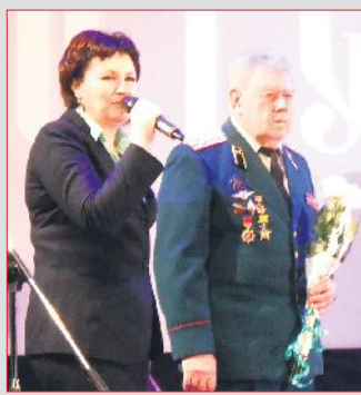
ПРАЗДНИЧНАЯ АФИША 4 стр.