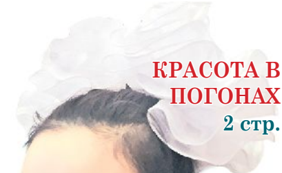
КРАСОТА В ПОГОНАХ 2 стр.