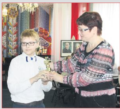
НАГРАДА ЮНЫМ МУЗЫКАНТАМ 3 стр.