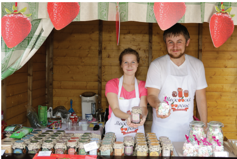
▲ В этом году с 13 по 23 августа Московский снова станет одной из площадок, на которой пройдет общегородской фестиваль «Московское варенье»

– Если бы этих территорий не было у Москвы, мы были бы вынуждены либо уплотнить застройку в Москве, либо резко уменьшать количество застройки и сокращать число предоставляемой недвижимости для горожан.