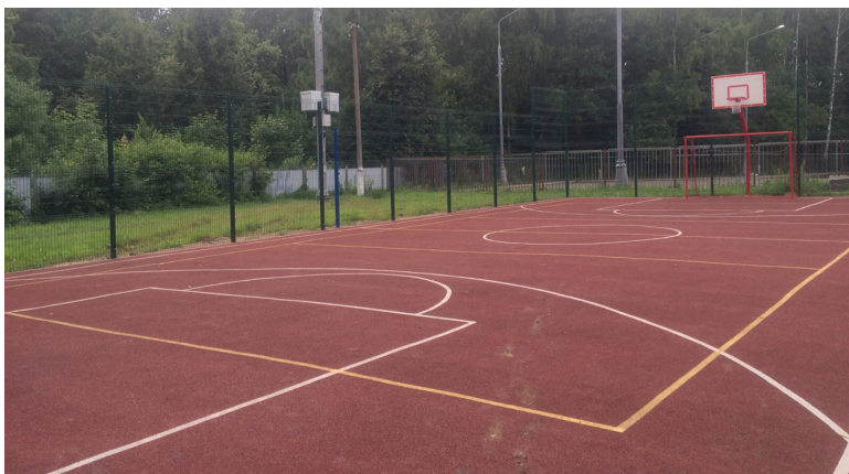
▲ Спортивная площадка в 1-м микрорайоне у дома № 1, построенная на месте водонапорной башни

Порядка 40% жилфонда столицы вводится в эксплуатацию в Новой Москве. За три года в ТиНАО построено 7 миллионов квадратных метров недвижимости, из которых свыше 4 миллионов – жилье. По прогнозам, к 2035 году эта цифра достигнет 100 миллионов квадратных метров недвижимости.