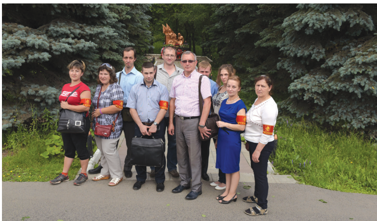
▲ Дружинники Московского

На территории поселения прошли два крупнейших фестиваля-ярмарки – «Московское варенье» и «Путешествие в Рождество». В рамках первого проведены различные мастер-классы, в том числе по росписи игрушек и валянию иглой из шерсти. Зимний фестиваль «Путешествие в Рожде-