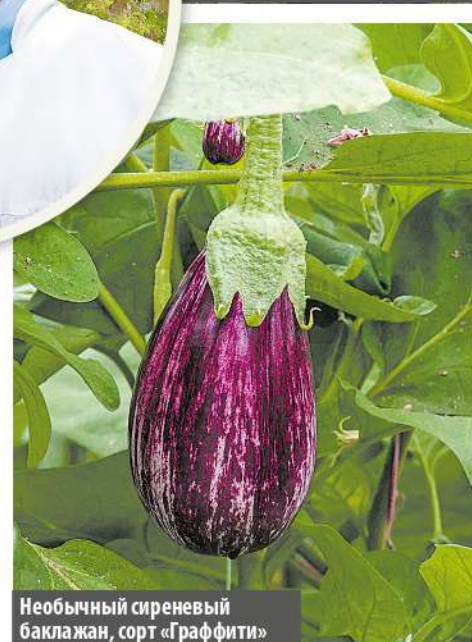
Необычный сиреневый баклажан, сорт «Граффити»