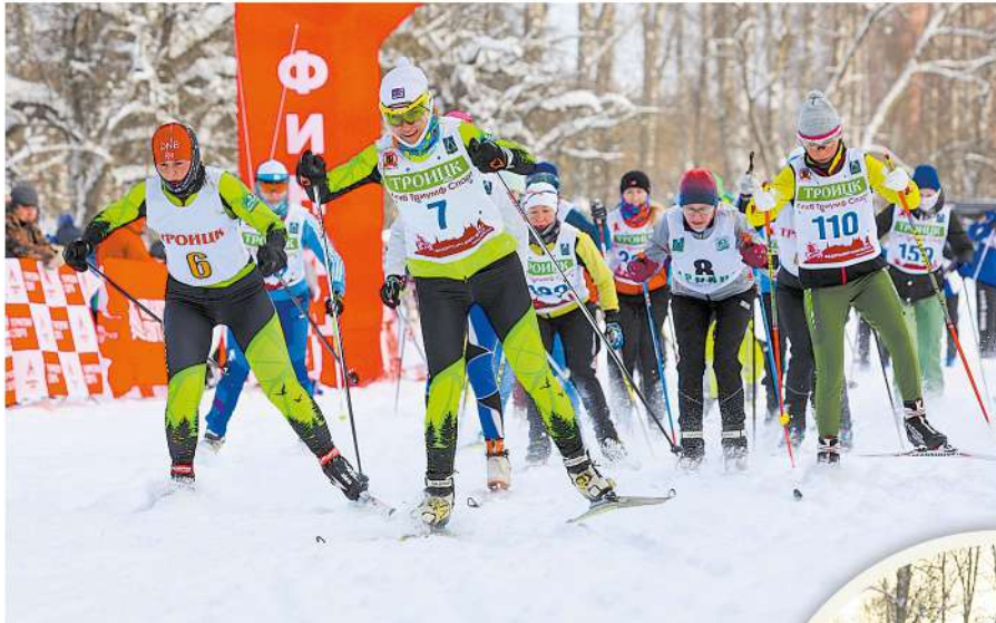
Спортсмены впервые за два года встали на лыжи

17 января лыжники со всей Новой Москвы съехались в поселение Вороновское на окружные отборочные соревнования по лыжным гонкам в рамках столичной Спартакиады «Спорт для всех». За победу боролась и сборная команда Московского.