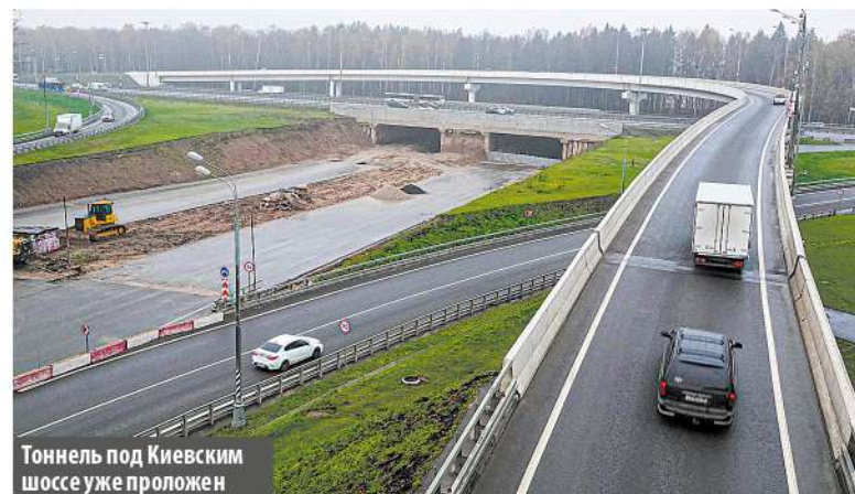
Тоннель под Киевским шоссе уже проложен

– Дорога в перспективе соединит район Солнцево, трассу Солнцево – Бутово – Видное и Киевское шоссе, значительно улучшив дорожную ситуацию на данной территории, в частности для пассажиров общественного транспорта, – цитирует Жидкина портал mos.ru .