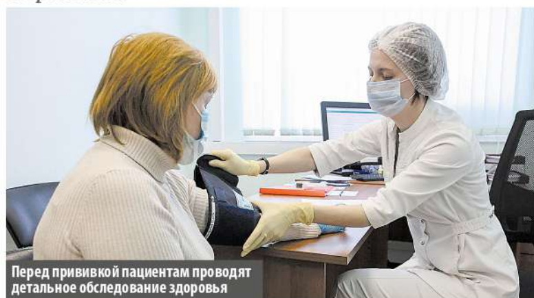
Перед прививкой пациентам проводят детальное обследование здоровья

Начать массовую вакцинацию россиян от коронавируса с понедельника, 18 января, поручил президент России Владимир Путин. Корреспонденты «МС» побывали в городской больнице Московского и сообщают подробности.