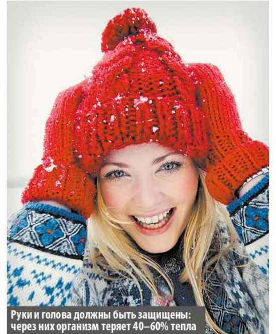
Руки и голова должны быть защищены: через них организм теряет 40–60% тепла