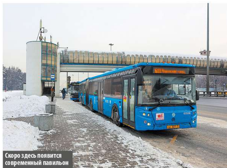
Скоро здесь появится современный павильон