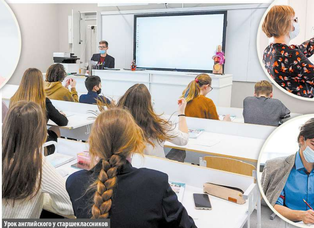
Урок английского у старшеклассников