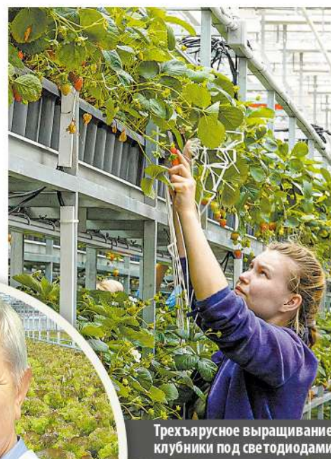
Трехъярусное выращивание клубники под светодиодами