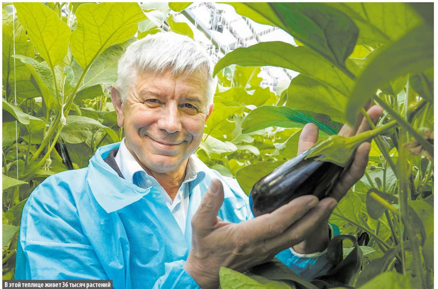
В этой теплице живет 36 тысяч растений

– В этот год запустили светокультуру баклажана, то есть будем выращивать его и зимой. Оборудовали в теплице на площади 0,5 гектара дополнительное освещение и будем выдавать примерно 2,5 тонны баклажанов в неделю. Хотели вообще всю теплицу переоборудовать, но средств в этом году нет, поэтому только полгектара. Там же, в этой теплице, посадили миниперчик, оранжевый, красный и зеленый, он сладкий и очень вкусный. У меня внуки