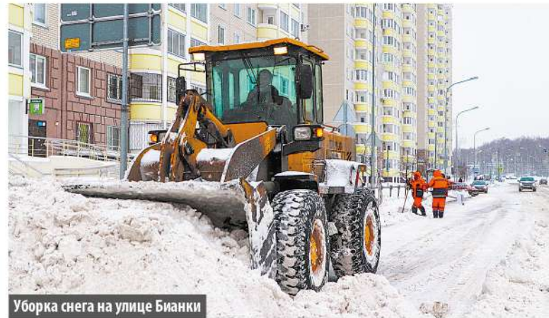
Уборка снега на улице Бианки

После двух рекордных снегопадов с московских улиц вывезли более миллиона кубометров снега. В нашем поселении специалисты провели работы по устранению последствий зимней непогоды.