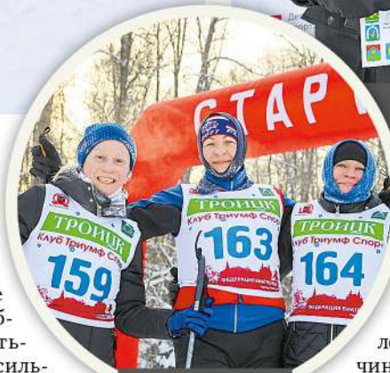
Лыжницы из Московского

Кругом были румяные и счастливые лица. Мороз щипал за нос и щеки, но спортсменов уже было не остановить. Любители лыж ждали эти соревнования целый год – прошлой зимой в столице не было снега, поэтому прокатиться по лесу и насладиться гонкой не удалось никому. Зато на прошлых выходных этой возможностью, казалось, воспользовался каждый. Даже морозы не стали помехой для спортсменов.