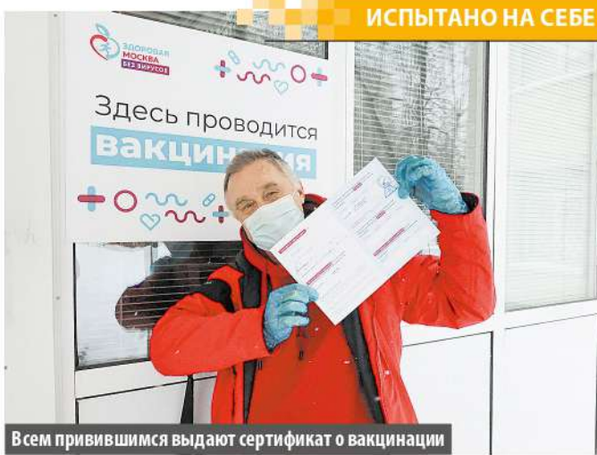
Всем привившимся выдают сертификат о вакцинации

Надо – так надо, спорить не стал. Впечатления от самой процедуры в основном положительные, разве что времени ушло много. После прививки ведь надо еще полчаса посидеть, чтобы медики убедились, что ты в норме. Сейчас, на второй день после вакцинации, чувствую себя хорошо. Разве что бодрости обычной нет. Но что-то мне подсказывает: это потому, что жена мне сегодня с утра ледяной водой на улице облить не дала!