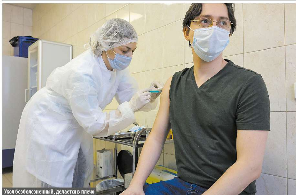
Укол безболезненный, делается в плечо