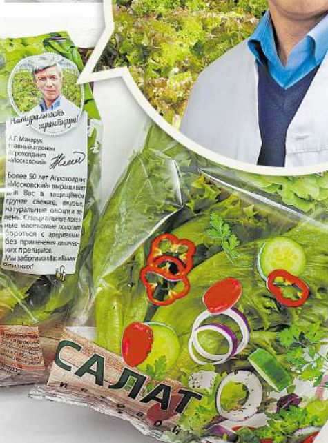
Упаковки салата с портретом главного агронома продаются во всех больших супермаркетах