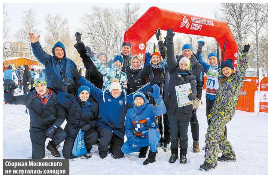
Сборная Московского не испугалась холодов

Анастасия КИБАНОВА