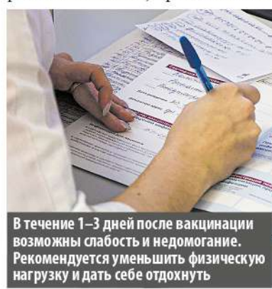
В течение 1–3 дней после вакцинации возможны слабость и недомогание. Рекомендуется уменьшить физическую нагрузку и дать себе отдохнуть

– На сегодняшний день довольно значительная часть записавшихся на вакцинацию в нашей больнице – люди старшего возраста. Те, кто относится к самой большой группе риска и тяжелее всего переносит COVID-19, – рассказывает